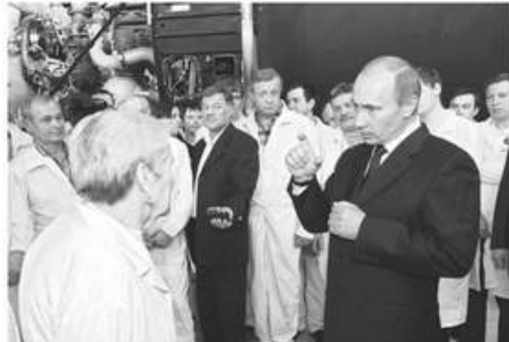
El primer ministro Vladimir Putin conversa con un trabajador durante su visita a una empresa estatal de investigación

"No es poco, pero tampoco desorbitado. Considero que nuestra actitud en la situa-